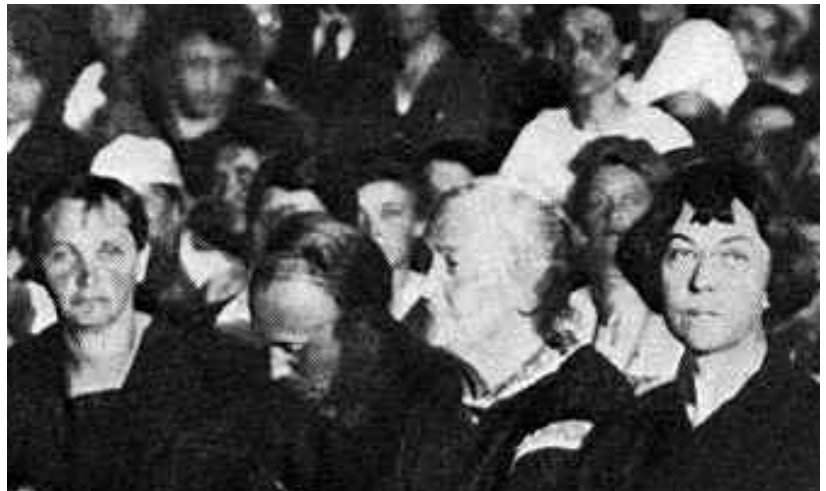
De derecha a izquierda: Alexandra Kollontai y Clara Zetkin en el II Congreso de la Internacional Comunista en 1920.

En este contexto, se levantaba de nuevo la necesaria vinculación entre feminismo y socialismo. En el caso de las mujeres negras, entre clase, raza y género. Fueron muchas las mujeres que trataron de analizar la lucha por la emancipación de las mujeres desde una perspectiva socialista, entendiendo el feminismo como la lucha contra el sistema de dominación sexual, el heteropatriarcado, y el socialismo como la lucha contra el sistema de clases. Juliet Mitchell, Roberta Hamilton o Sheyla Rowbotham, entre otras.