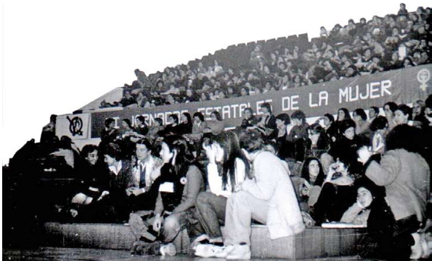
II Jornadas Estatales de la Mujer (Granada, 1979) de gran importancia para la historia del movimiento feminista en el Estado español.

La segunda ola, donde situamos, entre otras, la Declaración de Seneca Falls, a Elizabeth